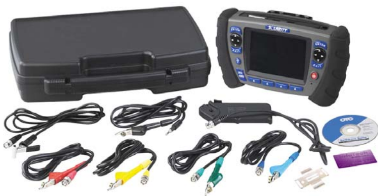
SOLARITY 4-channel scope kit

DRIVEABILITY AND COMPONENT TEST DIAGNOSTIC TOOL